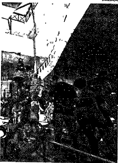
Recuo se deve à crise financeira provocada pelo distanciamento social

Um levantamento feito pela Federação de Comércio e Dirigentes Lojistas (FCDL) mostra que as vendas de Natal devem cair 3% neste ano, em comparação à 2020. De acordo com a entidade, a expectativa de gasto dos consumidores é de R$ 160.